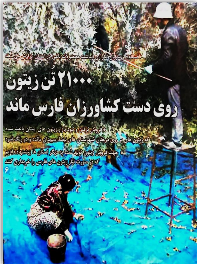
«فلسفه» از سرآمال تکراری انانست محصولات باغی در استان گزارش می دهد