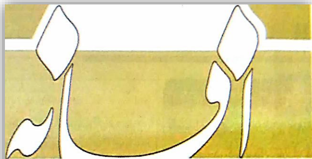
سه شنبه ۱۶ مهر ۱۳۹۸ ۹ صفر ۱۴۴۱/۱۸ اکتبر ۲۰۱۹ شماره ۳۹۸۲

وی با اشاره به اینکه حدود ۷ هزار هکتار زیتون کشت شده استان بارور است، می گوید: در جهت فروش محصول ریسون بارها از طریق شورای ملی ریسون نامه هایی را به وزارت کشاورزی، مجلس، صحت و ... ارسال