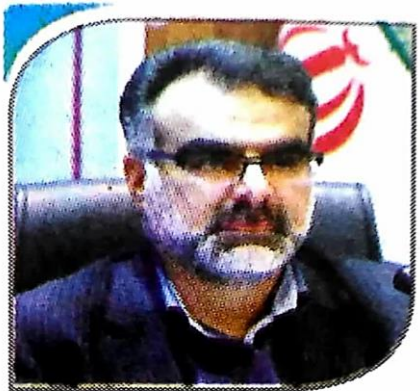
انجیرستان دیم استهبان ثبت جهانی می شود