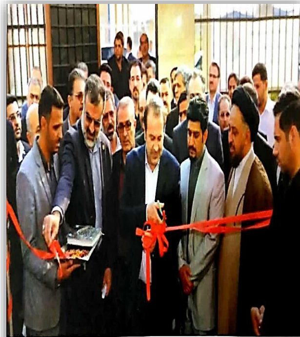
استاندار فارس دومین استان کشور از نظر کاهش نرخ بیکاری است