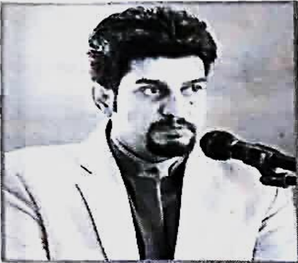
مدیرعامل شرکت فرآورده های آماده طبخ گل پونه: صادرات محصولات شرکت گل پونه به کشورهای خاورمیانه و اروپایی کلید خورد

است. مدیرعامل فرآورده های آماده طبخ گل پونه همچنین با اشاره به اجرای طرح ملی سلامت محور و نقشی که این محصولات در اجرای این طرح می توانند داشته باشند، اضافه کرد: حفظ اشتغال در حوزه بخش کشاورزی، جلوگیری از مهاجرت روستاییان به شهرها، تولید محصولات سالم، با کیفیت و قیمت پایین از دیگر ویژگی های فعالیت شرکت گل پونه است.