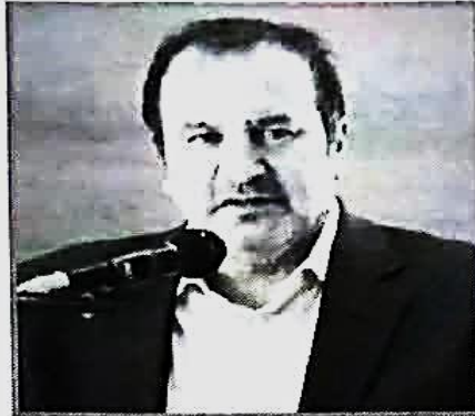
استاندار فارس: شرکت گل پونه مصداق عینی تحقق شعار رونق تولید است

به گزارش «خبر جنوب» گل پونه افتخارات متعددی کسب نموده که اخذ گواهینامه های ایزو ۹۰۰۱، ۹۰۰۸، ۹۰۰۶، ۱۰۰۰۶، و Fives، برنده شش سال متوالی تندیس رعایت حقوق مصرف کنندگان از سازمان صنعت، معدن و تجارت، دریافت لوح سپاس از دانشگاه علوم پزشکی شیراز در راستای سطح رضایتمندی مشتری و تولید کالای سالم و همچنین اخذ گواهینامه حلال مواد غذایی اسلامی بخشی از این افتخارات است.