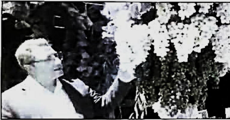
رهبز معظم جامه عمل پوشاند.

وی در پایان به اهمیت جشنواره انگور در معرفی باغات شهرستان کوار اشاره کرد و گفت: مردم فهیم این شهرستان مطمئناً می دانند که انگور جزئی از فرهنگ کوار است و باید به آن اهمیت فراوان داده شود.