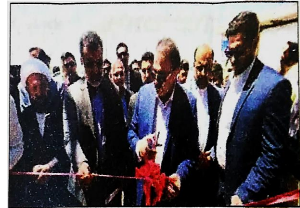
با حضور استاندار فارس انجام شد؛