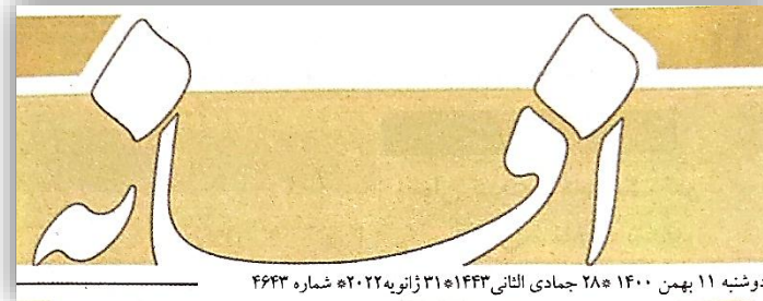
دوشنبه ۱۱ بهمن ۱۴۰۰ ۲۸ جمادی الثانی ۱۴۴۳ هجری قمری ۳۱ ژانویه ۲۰۲۲ شماره ۴۶۴۳

وی گفت: با توجه به وضع اعتباری دولت در چند سال گذشته و کمبود نقدینگی، تامین چنین اعتبار کلانی برای این طرح ها به تنهایی از سوی دولت امکان پذیر نیست و رویکرد ما استفاده از مشارکت های مردمی است. وی افزود: تورم بر افزایش هزینه های تمام شده طرح های آبخیزداری اثرات زیادی گذاشته به گونه ای که فهرست بهای اجرای این طرح ها امسال در مقایسه با سال گذشته ۲ برابر شده است.