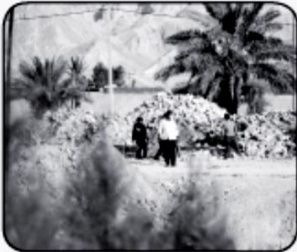
شهرستان لارستان با هشت شهر و ۱۷۹ روستای دارای سکنه و با جمعیتی حدود ۲۳۰ هزار نفر در فاصله ۳۸۰ کیلومتری شیراز قرار دارد.

میلارد ریال هم برای اسقالت و بهسازی راه های روستایی این شهرستان و ۳۰۰ میلیارد هم برای ۶ طرح آبخیزداری و مصوب سفر رئیس جمهوری در شهر بیرم تخصیص یافته است.