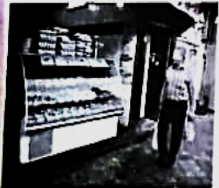
بازار مرغ شیراز

صف مرغ برچیده نشده* این هفته را می‌توان خلاصه‌ای از مشاهدات میدانی طی هفته‌های اخیر و بعد از اعلام قیمت مصوب مطرح کرد. از گسود گوشت مرغ و التهاب این بازار در فروردین ماه امسال که مگر در روزهای اخیر در سامانی از روز در بازارهای، روزهای معارها در سطح شهر تنها به صورت قطعه‌بندی مرغ را عرضه می‌کنند شروع در کنار صفهای مردمی شده صف آن در سطح شهر، صف‌های صف‌هایی هستند که حکایت از گسود و عدم توزیع باصاف دارد. ماه‌هاست صف‌های گزاسی مردم و به ویژه فصل صفت جامعه را در گرفته است. خصیصه مدیران در صلاح به میا مؤثر بوده بلکه با ایجاد مصیبات صد و بیست بر خستک و حرمت صف‌های گزاسی افزوده است این روزها گوشت فرم، گوشت مرغ و میوه برای طبقات فرودست جامعه در حال به خاطرهای پوسنی است، در روزهایی که مردم برای تأمین سبزی‌های تازه خود صحتیل صف‌های بی‌سلفه می‌شوند نوره هر ماه رتورد صدهای را به لب می‌رساند و بازار به حال خود رها شده است به هر ترتیب در ماه‌های پایانی سال ۹۹ قیمت مرغ به شکل بی‌سامانی در کشور افزایش داشت و صحر به تشکیل صف‌های