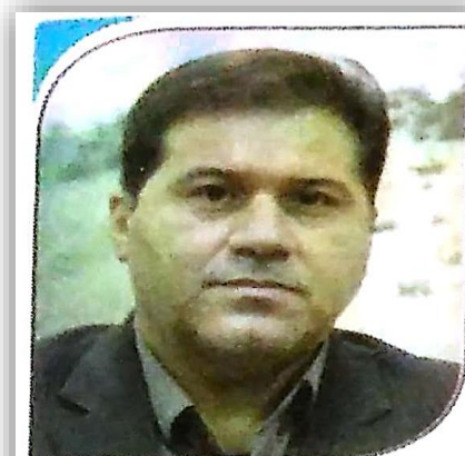
با ادامه حفاظت کنونی از منابع طبیعی، اثری از محیط زیست فارس باقی نخواهد ماند