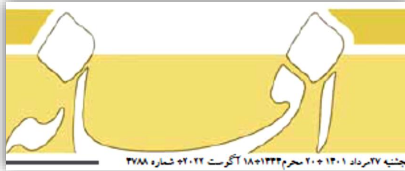
نخستین ۲۷ مرداد ۱۴۰۱ + ۲۰ محرم ۱۴۴۳ + ۱۸ آگوست ۲۰۲۲ + شماره ۳۷۸۸