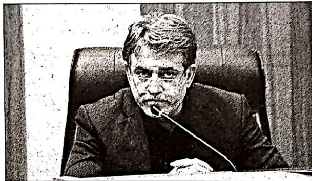
رو به رشد و توسعه بوده است، افزود: امیدواریم این مسیر با حضور