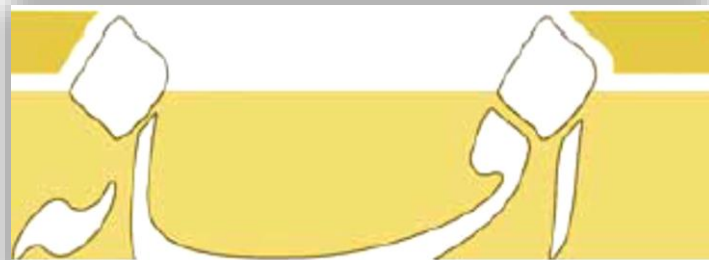
پنجشنبه ۱۷ شهریور ۱۴۰۱ + ۱۱ صفر ۱۴۴۴ هجری شمسی ۲۰۲۲ + شماره ۲۸۰۶

طبق ابلاغیه مذکور که به تصویب ارکان ذریع در بانک مرکزی رسیده است، مقرر شد در سال ۱۴۰۱، ۲۰ درصد تسهیلات پرداختی به بخش کشاورزی توسط بانک‌ها و مؤسسات اعتباری، در قالب تامین مالی زنجیره‌ای و کشاورزی قراردادی با اولویت بخش خصوصی و حمایت از تولیدات دانش بنیان و صادرات محور (با اولویت رعایت الگوی کشت بهینه ملی - منطقه‌ای) و بدون تحمیل بار مالی اضافی به منابع بانکی، پرداخت شود. براین اساس برای اجرای مصوبه مذکور، استفاده از شیوه‌نامه اجرایی «تامین مالی کشاورزی قراردادی» که قبلاً به شبکه بانکی ابلاغ شده و همچنین بهره‌مندی از ابزارهای تامین مالی زنجیره‌ای از قبیل «وراق کام» و «برات الکترونیکی» و نظایر آن در چارچوب ضوابط و مقررات جاری، مورد تاکید است.