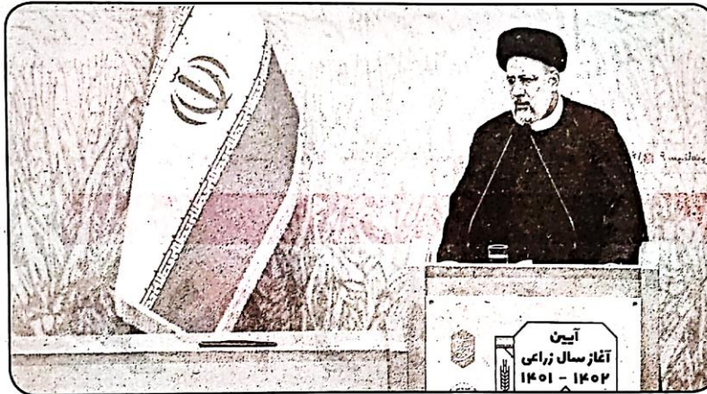
رئیس‌جمهور رونق اقتصاد کشور را در گرو کار و تلاش کارگران نظارت بیشتری می‌طلبد تا دست واسطه‌ها و دلالان قطع شود.

وی ادامه داد: باید برای آنچه در سفره مردم است، نیاز به خارج از کشور نداشته باشیم بلکه حتی بتوانیم صادرکننده محصولات کشاورزی باشیم.