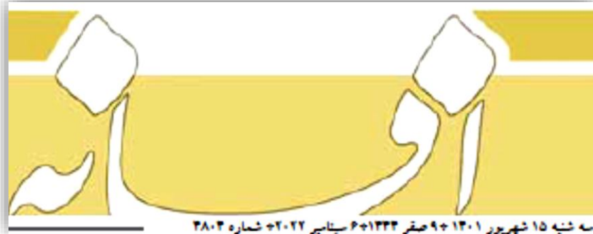
سه شنبه ۱۵ شهریور ۱۴۰۱ + ۹ صفر ۱۴۳۳ + ۶ سپتامبر ۲۰۲۲ + شماره ۲۸۰۳

رئیس هیئت مدیره اتحادیه مرغ تخم گذار استان تهران درباره اینکه اگر قیمت هر کیلو تخم مرغ بیش از ۵۰ هزار تومان و قیمت هر شله آن بیش از ۱۰۰ هزار تومان باشد، توان خرید مردم به شدت افت می‌کند؛ تأکید کرد: ما نیز به این مسئله آگاهیم اما مرغداران نیز چاره‌ای ندارند و بیش از این نمی‌توانند زیان را تحمل کنند و ادامه روند فعلی منجر به نابسودگی تولید خواهد شد. این فعال بخش خصوصی عنوان کرد: دولت باید چاره‌ای برای این مسئله بیندیشد به طوری که مصرف کننده قدرت خرید داشته باشد و تولید کننده نیز در زیان قرار نگیرد.