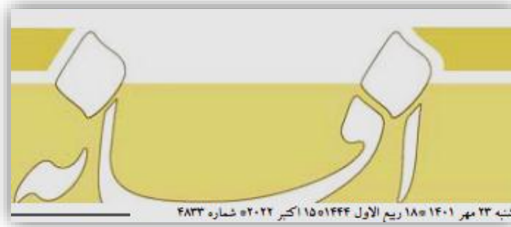
شنبه ۲۳ مهر ۱۴۰۱ ریح الاول ۱۵۰۱۴۴۴ کبیر ۲۰۲۲ شماره ۴۳۳

پس از انعقاد قرارداد صادرات و فرآورده ۲۰۰ تن زعفران ایران به مقصد کشور قطر، نخستین محموله از این قرارداد بارگیری و جهت فرآوری به این کشور ارسال شد. نام ایران در بازارهای جهانی با نام «زعفران» گره خورده است و کمتر کشوری را می‌توان نام برد که در آمار کالاهای وارداتی خود نیمی از زعفران ایرانی نداشته باشد. این گزارش بیش از ۹۰ درصد زعفران جهان توسط ایران تولید می‌شود و ایران تامین کننده اصلی بازارهای جهانی این محصول است. اگرچه زعفران در ایران بیشتر در مصارف خوراکی مورد استفاده قرار می‌گیرد اما بخشی عمده‌ای از کشورهای اروپایی، این طلای سرخ را فرآوری کرده و در صنایع گوناگون مانند داروسازی مورد استفاده قرار می‌دهند و با توجه به اینکه ایران تولیدکننده مرغوب‌ترین زعفران جهان به شمار می‌رود و متقاضیان زیادی از سراسر دنیا، خواهان این محصول استراتژیک ایرانی هستند. این راستا و برای ارتقا جایگاه زعفران ایران در جهان و فرآوری بهتر زعفران ایران، در ۲۷ شهریورماه سال جاری و در فاصله چند ماه تا آغاز جام جهانی ۲۰۲۲ قطر، بزرگ‌ترین قرارداد تجاری در حوزه زعفران بین ایران و قطر برای انتقال و فرآوری ۲۰۰ تن زعفران با ارزش اولیه ۳۰۰ میلیون دلار، با حضور شخصیت‌های سیاسی و اقتصادی دو کشور به امضا رسید و طبق توافق انجام شده نخستین محموله صادراتی زعفران از محل مازاد نیاز داخلی کشور، در گمرک مشهد یا حضور مدیر کل سازمان استاندارد، مدیر کل گمرک و نمایندگان وزارت جهاد کشاورزی، بارگیری و به مقصد کشور قطر ارسال شد و در هفته آینده نیز دومین محموله ارسال خواهد شد.