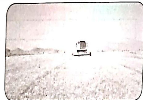
داور یزدانی - ارسنجان

سرپرست مدیریت جهاد کشاورزی شهرستان ارسنجان از آغاز برداشت جو