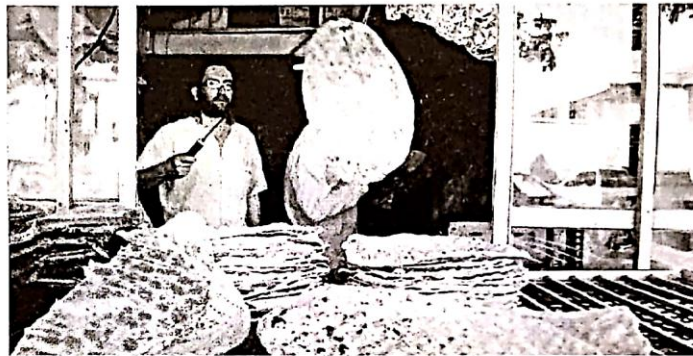
۶۰۰ هزار تومان هم می‌رسد.

ساداتی‌نژاد با بیان این که سال گذشته با خشکسالی شدیدی مواجه بودیم، گفت: کل گندم خریداری‌شده در سال ۱۴۰۰، ۴/۵ میلیون تن بود. این نشان می‌دهد نسبت به هشت میلیون تنی که در بعضی سال‌ها می‌خریدیم این