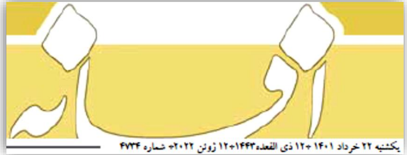
یکشنبه ۲۲ خرداد ۱۴۰۱ + ۱۲ ذی القعدة ۱۴۴۲ + ۱۲ ژوئن ۲۰۲۲ + شماره ۶۷۲۴