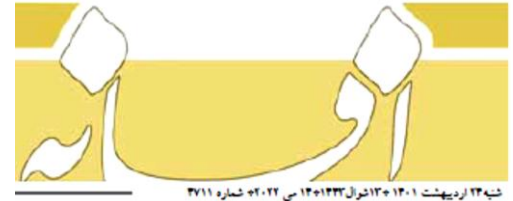
شبه ۱۲ ردهبشت ۱۳۰۱ تا ۱۳۰۲ خرداد ۱۳۹۲ تا ۱۳۰۲ شماره ۳۷۱۱