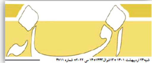
شبه ۱۳ رديبهشت ۱۳۰۱ + ۱۳ تيرال ۱۳۰۱ + ۲۲ تا ۲۱ شماره ۲۷۱۱

اختصاص می‌یافت به محض اعلام، به دامدار یک فرصت یک روزه داده می‌شد تا نسبت به خرید نهاده اقدام کند که دامدار با توجه به مشکلات مالی در تأمین آن با مشکلاتی مواجه بود.