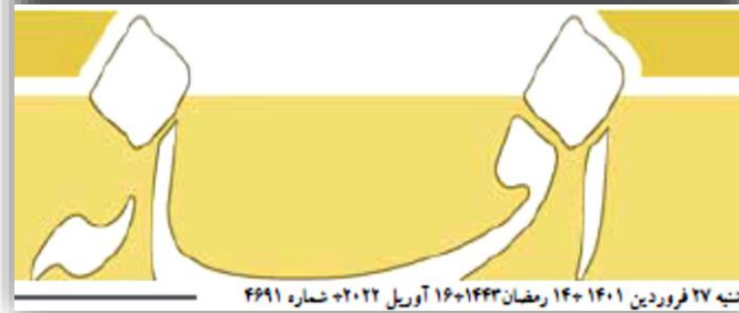
شنبه ۲۷ فروردین ۱۴۰۱ + ۱۴+ رمضان ۱۴۴۳ + ۱۶ آوریل ۲۰۲۲ + شماره ۴۹۹۱