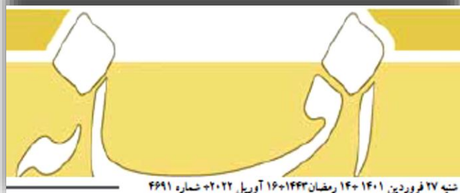
شنبه ۲۷ فروردین ۱۴۰۱ + ۱۴۰۱ رمضان ۱۴۴۳ + ۱۶ آوریل ۲۰۲۲ + شماره ۴۹۹۱