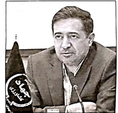
رئیس سازمان جهاد کشاورزی استان فارس

این مقام مسئول با اذعان به اینکه با توجه به افزایش هزینه های تولید و افزایش قیمت گندم در بازارهای جهانی زرمه هایی مبنی بر افزایش نرخ خرید تضمینی گندم برای جلوگیری از هر گونه قاچاق گندم وجود دارد، اظهار کرد: نیروهای انتظامی، امنیتی و اطلاعاتی در جلوگیری از هرگونه قاچاق و