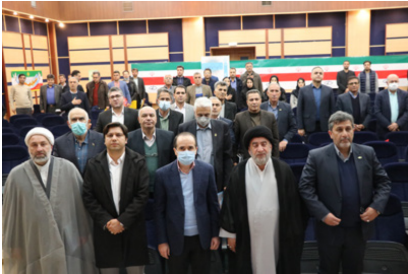
شیرازی نژاد رئیس موسسه تحقیقات واکسن و سرم سازی رازی شعبه جنوب کشور: