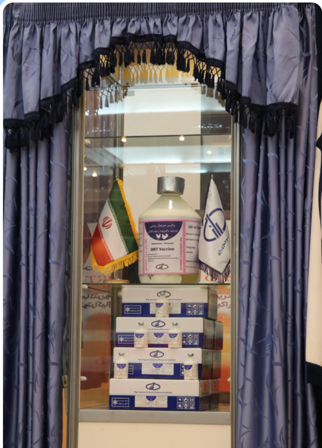
رونمایی از واکسن اورنیتوباکتریوم رینوتراکیال موسسه تحقیقات واکسن و سرم سازی رازی شیراز