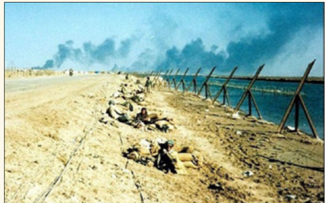
تصاویری از عملیات والفجر ۸