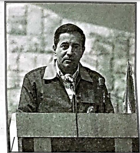
رئیس سازمان جهاد کشاورزی فارس از آغاز بهره‌برداری ۴۸ طرح عمرانی و اشتغالزای کشاورزی در طول هفته جهاد کشاورزی در این

دهقان پور خاطرنشان کرد: سه طرح احداث سردخانه نگهداری مواد غذایی و کانال‌های آبیاری نیز در این ایام کلنگ‌زنی می‌شود. رئیس سازمان جهاد کشاورزی فارس با اشاره به اینکه طرح‌های اشتغالزای قابل افتتاح بخش کشاورزی شامل ۲۵ طرح با