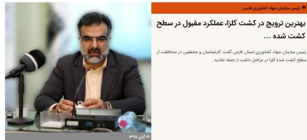
رئیس سازمان جهاد کشاورزی فارس:

شیراز- معاون توسعه مدیریت و منابع وزیر جهاد کشاورزی گفت: باید از شرکت های دانش بنیان در تحول سازمانی و توانمند سازی نیروی انسانی بهره گیری شود.