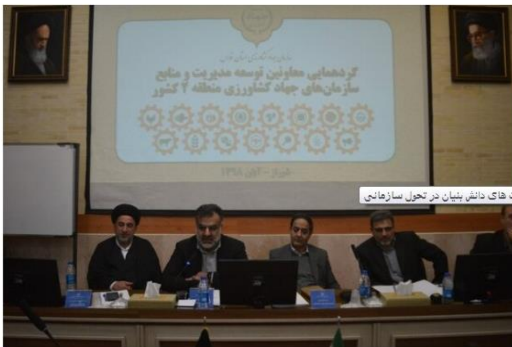
کتاب های دانش بنیان در تحول سازمانی

شیراز- معاون توسعه مدیریت و منابع وزیر جهاد کشاورزی گفت: باید از شرکت های دانش بنیان در تحول سازمانی و توانمند سازی نیروی انسانی بهره گیری شود.