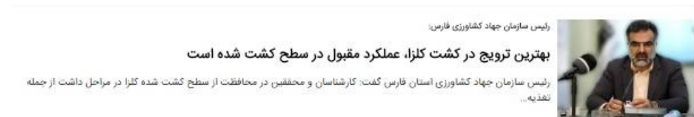
رئیس سازمان جهاد کشاورزی فارس: