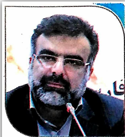
رتبه دوم فارس در تولید مرکبات کشور