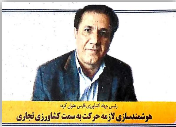
رئیس جهاد کشاورزی فارس عنوان کرد: هوشمندسازی لازمه حرکت به سمت کشاورزی تجاری