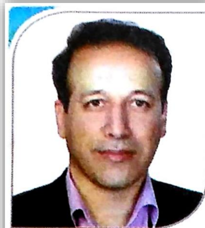
انجام واکسیناسیون رایگان تب بر فکی برای یک ونیم میلیون رأس دام عشایر فارس