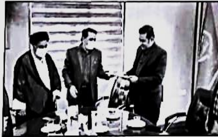
آرژشمن عشایر را بشناسند و در عمل بر آنها ارزش بگذارند. رئیس سازمان جهاد کشاورزی فارس در

در فارس مس از گذشته استفاده نمود، افزود: صداقت، شجاعت، غیرت، تحمل شخصی ها، ولایتداری، امانتداری و شجاعت از ویژگی های بارز و متمایز بوده که در جامعه عشایری وجود دارد. رئیس سازمان جهاد کشاورزی استان فارس نقش عشایر در صادرات قیل نا دوران بسیاری انقلاب اسلامی ایران و رساندن آنها به استان در دفاع مقدس را برجسته توصیف و تصریح کرد؛ تاریخ عشایر گواهِ بر سر است جامعه عشایری است و باید گفت عشایر ارجمونی خود را از دهه های قبل پس داده و محسین بزمیان متعلق به دیروز و امروز است و مدیران باید ظرفیت گران سنگ و