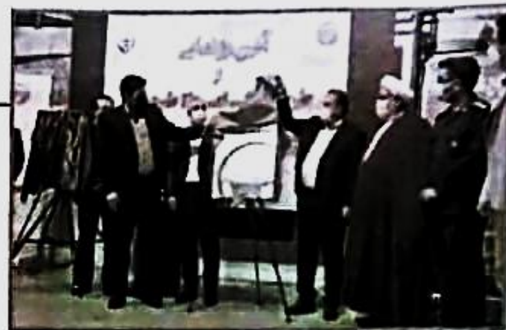
آیین رونمایی از طرح هنگ امداد طبیعت و افتتاح واحد مدیریت فناوری سازمان منابع طبیعی با حضور استاندار فارس برگزار شد. استاندار

استاندار فارس: مدیریت مشارکتی در حفظ منابع طبیعی اثر گذار است