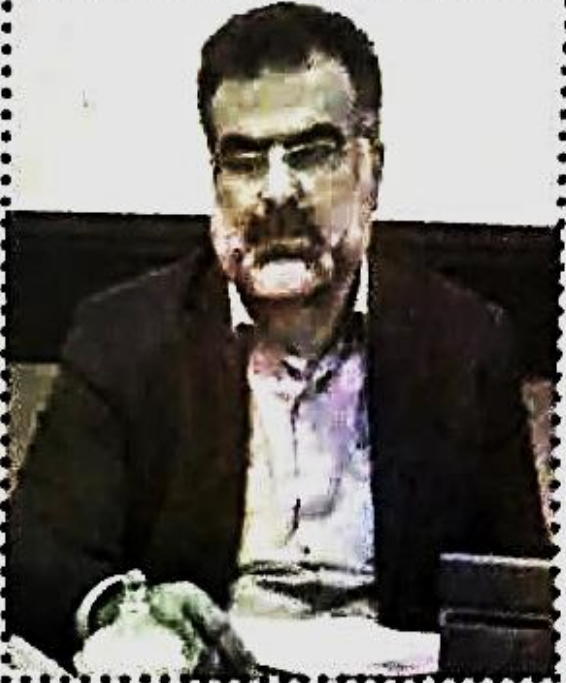
رئیس سازمان جهاد کشاورزی فارس، درباره نحوه استفاده آب در مساف

کشاورزی گفت: تمام استراتژی‌های سازمان جهاد کشاورزی بر مبنای آب است. ما باید در مصرف آب صرفه‌جویی کرد.