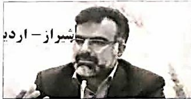
امیر آرز - اردبیل

جنوب کشور در شهرستان لامرد با سرمایه گذاری بیش از ۱۸ هزار میلیارد تومان بوده است، که این واحد یک صنعت مادر است و موجب می شود بر پایه آن صنایع پایین و بالا دستی بسیاری در کشور شکل گیرد و در توسعه اقتصادی استان نقش