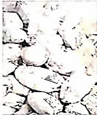
برنج کیلویی ۸ هزار تومان