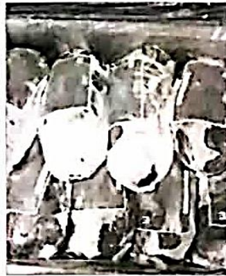
گوشت منجمد کیلویی ۴۲ هزار تومان

فروشان مواد غذایی و بهداشتی شیراز افزود: برای ماه مبارک رمضان ۳ هزار تن برنج هندی در نظر گرفته شده که دو برابر کل سرانه برنج استان در ماه است. رزاق منش گفت: از ابتدای فروردین تا کنون نیز ۸۰۰ تن برنج در هزار نقطه از شهر شیراز توزیع شد.