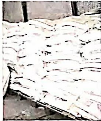
مرغ منجمد کیلویی ۱۲ هزار تومان