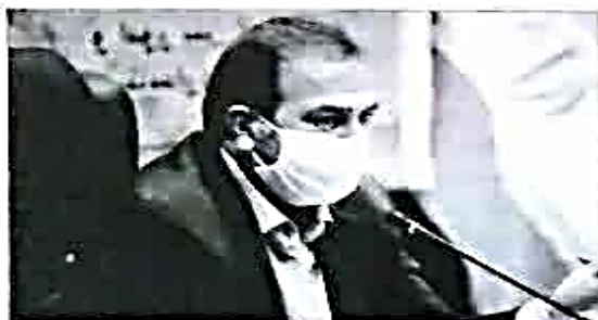
کوشش ظاهره جهانی

زمانی آغاز می شود که استفاده از سم و کود به صورت نادرست و غیرهوشمندانه به مصارف کشاورزی برسد. معاون بهبود تولیدات گیاهی استان، از زیر کشت رفتن ۸۰ هزار هکتار محصولات گواهی شده در استان فارس خبر داد و گفت: از این میزان زیرکشت ۲۰۲ میلیون تن برداشت می شود که از این مقدار ۹۰۰ هزار تن برای فارس مصرف می شود و بقیه به استان های مجاور صادر می گردد.