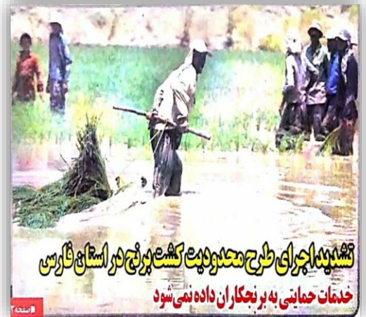
تشدید اجرای طرح محدودیت کشت برنج در استان فارس

دوشنبه ۲۲ اردیبهشت ۱۳۹۹ | سال بیست و سوم | شماره ۶۴۰۴