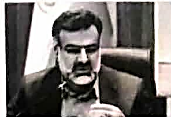
عکس ظاهر و جدایی

وی اضافه کرد: شهرستان فیروزآباد، یکشنبه شب اولین شب مبارزه با ملخ صحرایی را گذراند و دسته کوچکی از ملخ در مناطق کنار سیاه این