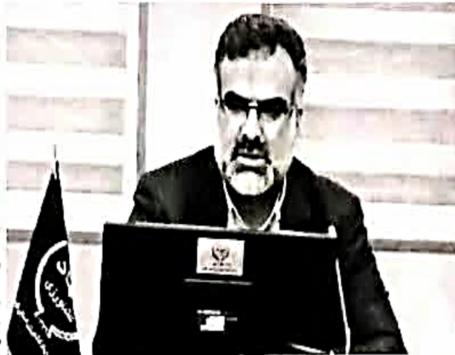
رئیس سازمان جهاد کشاورزی فارس

وی با اشاره به اینکه استان فارس همچنان در سکوی اول اجرای آبیاری تحت فشار در کشور قرار دارد، بیزامون