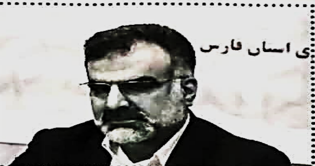
رئیس استان فارس

وی، افزایش ظرفیت سردخانه‌های استان فارس را از گام‌های موفق در بهبود فضا محمولات کشاورزی دانست و افزود: هم‌اکنون سردخانه‌های این استان از ظرفیت نگهداری ۴۵۰ هزار تن محصولات کشاورزی برخوردار است و این ظرفیت تا ۸۰۰ هزار تن قابل افزایش است. این مقام مسئول، همچنین تعیین تکلیف بدهی‌های موقوف کشاورزان، پرداخت جرایم و دیرکرد این بدهی‌ها توسط دولت را از دیگر اقدامات در بهبود وضعیت کشاورزان دانست و گفت: استان فارس در این زمینه دارای مقام اول در کشور است.