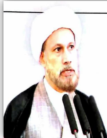
نماینده ولی فقیه در فارس:

* سه‌شنبه * ۲۰ شهریور ۱۳۹۷ * ۱۴۴۰ * 11 SEP 2018