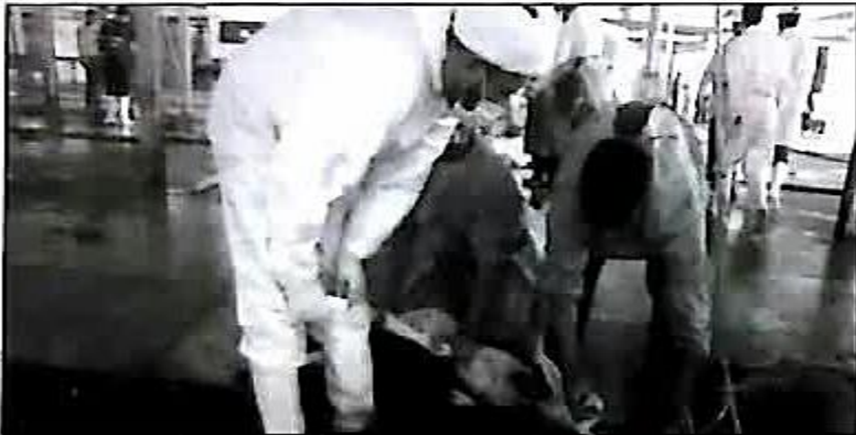
و ذابحین در کشور پیشرو است.

مستول حوزه نمایندگی ولی فقیه در سازمان دامپزشکی کشور خاطر نشان کرد: به دنبال ایجاد سازمانی تحت عنوان سازمان حلال در کشور هستیم که در حال حاضر به دستور رئیس جمهور شورای سیاست گذاری حلال در کشور راه اندازی شده که شامل ۴ کمیته است.