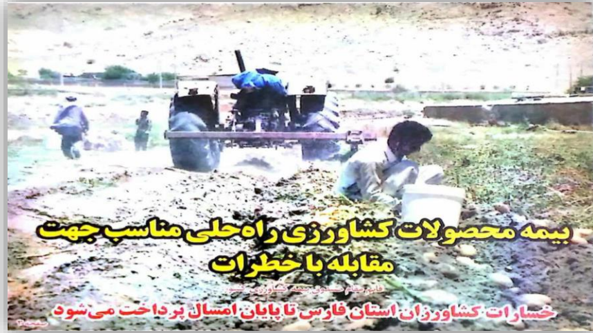
بیمه محصولات کشاورزی راه حلی مناسب جهت مقابله با خطرات خسارات کشاورزان استان فارس تا پایان امسال پرداخت می شود