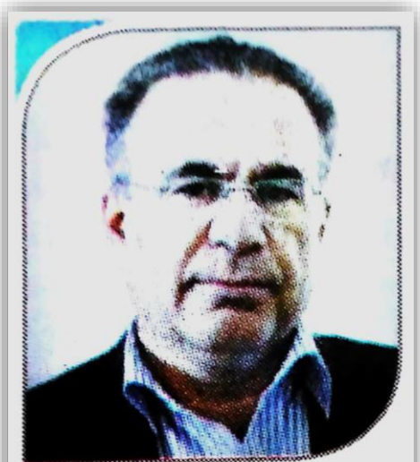
کمبود آرد در فارس وجود ندارد