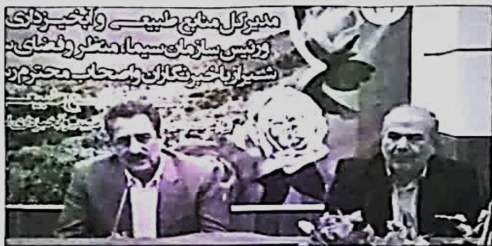
مطبق به شدت در خطر باشد. نه گفته می و دلیل آلودگی جدی که برای تولید زغال در این مناطق وجود دارد از نظر محیط رسی بحرانی است که در راستای برخورد با این موضوع گفت های ویژه برای مراقبت در نظر گرفته شده و همچنین دانشان این محور را داده که در شهرتسا شرکتی و با متخلفین برخورد شود.

• بیش از ۹ میلیون هکتار از عرصه های فارس سند دولتی دارند بوسنیایی با اشاره به احد سند مالکیت بیش از ۹ میلیون و ۲۰۹ هزار هکتار از عرصه های منابع طبیعی استان عنوان کرد: این سند به نام دولت و در راستای دفاع از حق و حقوق عمومی موثر است که ۲۱۰ هزار هکتار از آن در قالب طرح کاداستر دارای سند تک برگ و به نام دولت صادر شد و وی در خصوص رسیدگی به مشکلات جنگل نشسان و بهره برداران برای تأمین سوخت گفت: در همین راستا بیش ۳۸۶ خلووار روستایی در مناطق بحرانی انگرمنک جویرندی، کیسول و تورگاری توریج شد. نه گفته مدیرکل منابع طبیعی و آبخیزداری فارس خشکیده گی یکی از تهدید های دیگری است که عرصه منابع طبیعی را تحت تاثیر قرار داده که در این رو سالانه ۶ هزار هکتار از این عرصه ها پایش می شود.