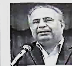
مدیر کل جدید تعاون روستایی فارس: هیات های مدیره شرکت های تعاونی و اتحادیه ها باید از بین اعضا انتخاب شوند