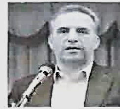
نماینده مردم شیراز در مجلس: مدیران به بخشنامه های گره گشا توجه کنند نه گره انداز

انتصاب افراد شایسته نباید فدای مسائل حاشیه ای شود نماینده مردم شیراز در مجلس شورای اسلامی هم که از دیگر سخنرانان این جلسه بود خواستار توجه به بخشنامه های گره گشا به جای استناد به بخشنامه های گره آنداز شد و گفت: مدبری که دنبال بخشنامه و قانون باشد