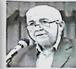
عضو هیات مدیره سازمان تعاون روستایی کشور: شبکه تعاون روستایی جای بازنشسته های جهاد کشاورزی نیست

سیاست سازمان تعاون روستایی حمایت از اقصاد حرفه ای و متخصص است در بخش دیگری از این مراسم عضو هیات مدیره سازمان تعاون روستایی کشور طی سخنانی به جایگاه فارس در بخش کشاورزی کشور اشاره کرد و گفت: فارس در