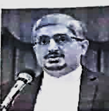
مدیر کل سابق تعاون روستایی فارس: علی رقع تحریم ها بیش از ۱۰۰ هزار تن محصولات کشاورزی از فارس به بازارهای هدف صادر شد

صادرات محصولات کشاورزی توسط تعاون روستایی علیرغم همه مشکلات موجود مدیر کل پیشین تعاون روستایی استان فارس هم در این بیان کرد: با وجود مشکلاتی مانند کاهش سطح آب های زیر زمینی، عدم تامین نهاده های کشاورزی و افتات اما تولیدات بخش کشاورزی این استان نه تنها کاهش نداشته بلکه صادرات محصولات کشاورزی بیاتگر افزایش تولید این محصولات است. احد پهیخت حقیقی افزود: ظرف چهار سال گذشته، بیش از ۱۰۰ هزار تن محصولات کشاورزی از استان فارس به بازارهای هدف