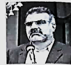
رئیس سازمان جهاد کشاورزی فارس: تشکیلات فرمایشی نمی توانند در بخش کشاورزی نقش آفرینی کنند