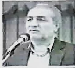
معاون استاندار فارس: سهم تولید کننده باید در قیمت نهایی محصولات کشاورزی افزایش یابد

عضو هیات مدیره سازمان تعاون روستایی کشور در شیراز اعلام کرد: بهران بی اعتمادی به جان شبکه تعاون روستایی افتاده است رشد جمعیت روستایی در فارس علی‌رغم پتانسیل‌ها منفی است