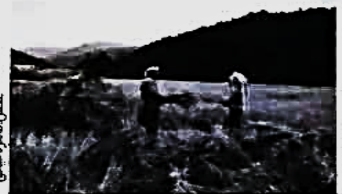
تکس، ظاهر و حیاتی

صد رنجبری در این باره می‌گوید خوشبختانه امسال در بازار برنج در کل کشور شاهد کمترین تنش بودیم اما این امر جدای از بازار برنج کامفیروزی در استان فارس بوده است چراکه